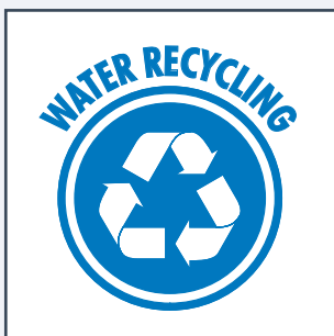
SISTEMA DI RICIRCOLO DELL'ACQUA SYSTÈME DE RECIRCULATION SISTEMA DE RECIRCULACION