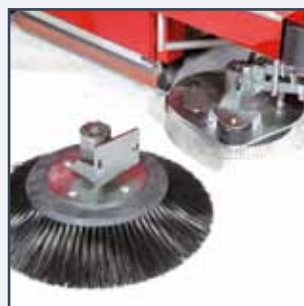
SPAZZOLA LATERALE LAVANTE O SPAZZANTE CEPILLO LATERAL LAVADO O BARRIDO BROSSE LATERALE LAVAGE O BALAYAGE E