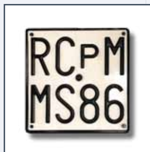
OMOLOGAZIONE STRADALE KIT OMOLOGACIO'N PARA CIRCULACIO'N VIAL KIT D'HOMOLOGITION ROUTIÈRE