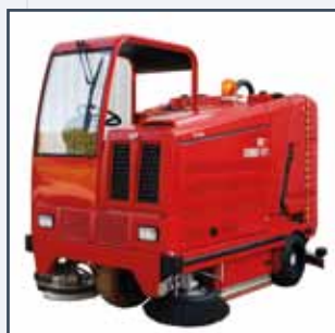
CABINA CABINA CABINE